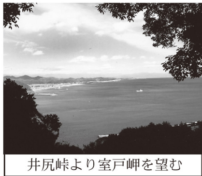
井尻峠より室戸岬を望む

土佐市高岡市街より塚地峠を指して歩く。峠にトンネルが有るが、旧へんろ道の塚地峠道を登る。頂上、