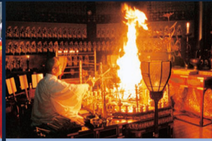
不動明王 護摩供養